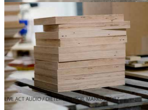
Illustration für / licensed for: LIVE ACT AUDIO GmbH | Burgstallung | 18257 Sonthofen | Germany | T +49 8321 6078000 | www.live-act-audio.de